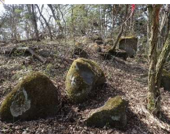
山の上に転がる苔むした丸い石