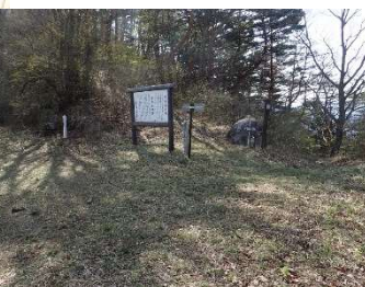
旅人も一休み、立峠茶屋跡