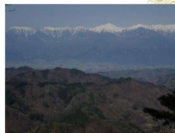
北アルプスの眺め