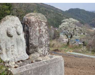
里の春を見つめる石仏たち